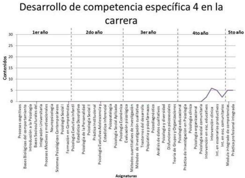
Gráfico N°2: Desarrollo de Competencia específica 4 en la carrera.

Con base a los análisis antes descritos se seleccionó la asignatura EPS 454 “Intervención en Escenarios Educativos”, ya que se estimó que sería la que permitiría la implementación de un ECOE, considerando las características de la metodología de enseñanza la cual parece como más consistentes con la naturaleza de este tipo de evaluación. Con el propósito de aportar coherencia entre el ECOE que se estaba diseñando y la metodología de enseñanza-aprendizaje, se incorporó en el Programa de Asignatura 2019 dos instancias formativas: Supervisiones grupales que acompañaron el proceso de intervención que tradicionalmente se realiza en esta asignatura, las que se enfocaron en la retroalimentación individual y grupal constante con respecto a las acciones que se desarrollaban en terreno; y Talleres de simulación en aula , los que pretendían generar espacios en que los y las estudiantes pudiesen ejercitar las actividades planificadas por ellos previa a su implementación en los contextos educativos en que realizaban sus intervenciones reales, a finde ejercitar las habilidades necesarias para ejecutar dichas acciones, recibiendo retroalimentación del desempeño por parte de docentes y estudiantes.